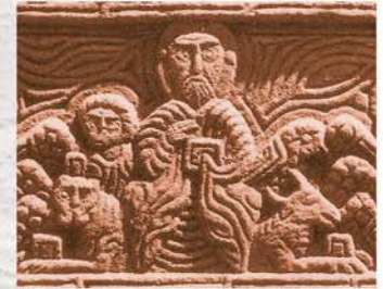
Détail du linteau d'un Khatchkar (1602)