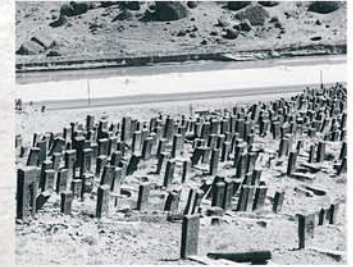
Ancienne vue du cimetière de Djoulfa

L'un des rares Khatchkars de Djoulfa, "rapatrié" en Arménie