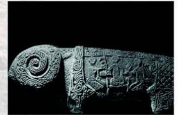
Des pierres tombales typiques de l'Art...