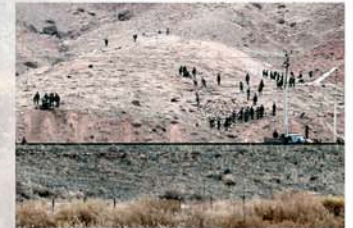
... arménien, saccagées par l'Armée azérie

CCAF (Conseil de Coopération des organisations Arméniennes de France) Conception graphique, réalisation & rédaction : Seta Papazian & Collectif VAN Documentation : PEAJD